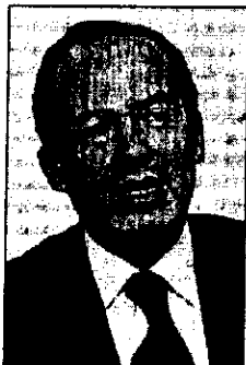
37% Felipe Calderón PAN