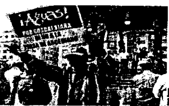
Poco a poco el gobernador se convirtió en el 'Jefe de Gobierno' por su conducta...