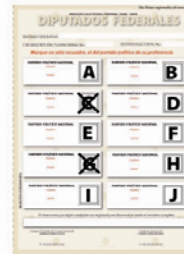
b) Cuando el elector marque toda la boleta o dos o más cuadros en la boleta sin existir coalición entre los partidos cuyos emblemas hayan sido marcados.