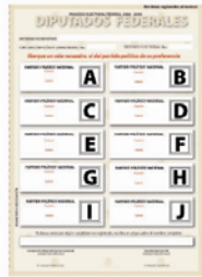
a) Aquel expresado por un elector en una boleta que depositó en la urna, sin haber marcado ningún cuadro que contenga el emblema de un partido político.