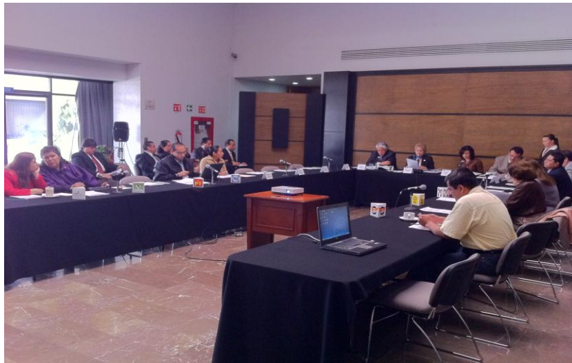
Sesión del Órgano Garante de la Transparencia y el Acceso a la Información Pública

4. Así mismo, fueron aprobados en sus términos por unanimidad de sus integrantes, diversos proyectos de recursos de revisión.