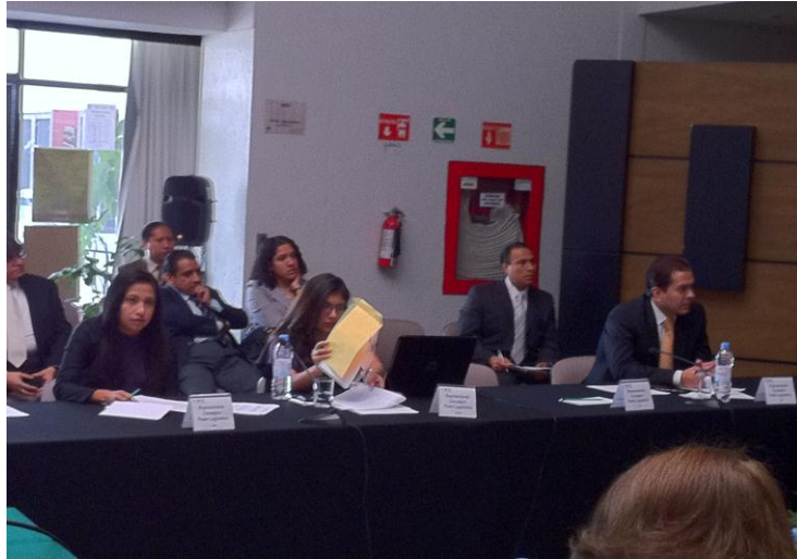
Discusiones en las reformas al RIFETAIP

Finalmente ambos proyectos fueron aprobados en Consejo General mediante acuerdo CG188/2011 del 23 de junio del año en curso, los cuales se publicaron el 28 de junio de 2011 en el Diario Oficial de la Federación, los cuales se vinculan con las actividades de este Órgano Garante.