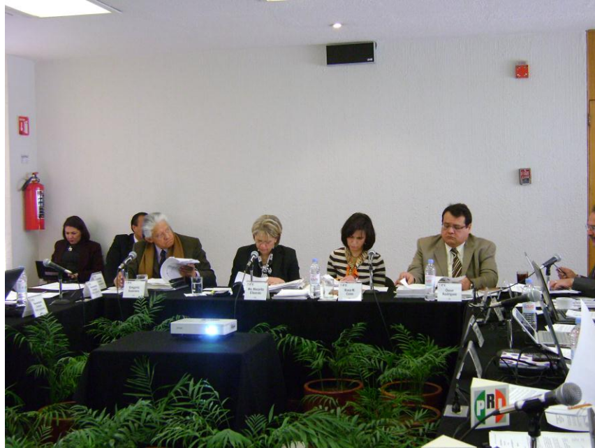
Integrantes del Órgano Garante de la Transparencia y el Acceso a la Información Pública