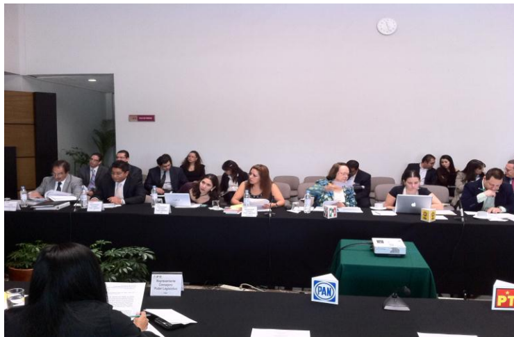
Las representaciones partidistas comentando sus observaciones

Por lo que en el caso en particular, se considera que en la especie, no existe ningún procedimiento del cual se desprenda actuación alguna de esta autoridad que deba ser publicada en los estrados requeridos en el oficio PCEN/2011/320, como tampoco se puede observar actuación de algún tercero interesado, medio de impugnación o acuerdo que haya recaído a los mismos.