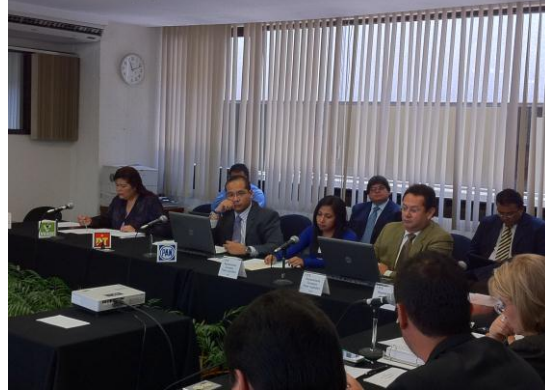
Participación de los Representantes de los Partidos Políticos y de los Representantes del Poder Legislativo

En la siguiente tabla se informa respecto de la asistencia en el transcurso de noviembre-diciembre 2010 y lo correspondiente de Enero a Diciembre del año 2011 a las Sesiones por parte de la Consejera Presidenta, del Contralor General, el Especialista y la Secretaria Técnica.