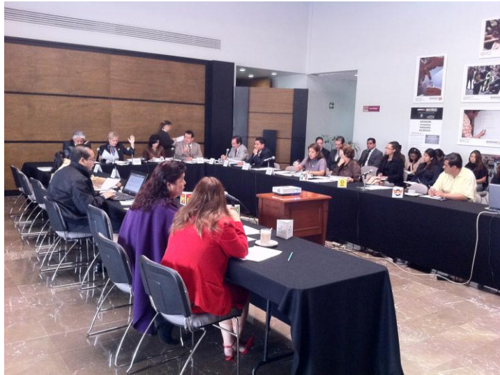
Aprobación del orden del día por parte de los integrantes del OGTAIP

2. Así mismo, fueron aprobados por unanimidad de sus integrantes, diversos proyectos de recursos de revisión.