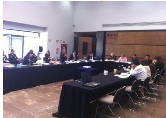
Décima Primera Sesión Extraordinaria del OGTAI celebrada el 19 de Diciembre de 2011 en el Lobby del Edificio “B”

Así mismo, fueron aprobados 12 recursos de revisión, destacando la excusa como impedimento propuesta por la Secretaria Técnica del Órgano Garante, la cual se determinó por unanimidad de votos como improcedente en razón de que no se actualizan los supuestos normativos precisados en el párrafo 2 del artículo 22 del Reglamento de Sesiones del Órgano Garante de la Transparencia y el Acceso a la Información Pública .