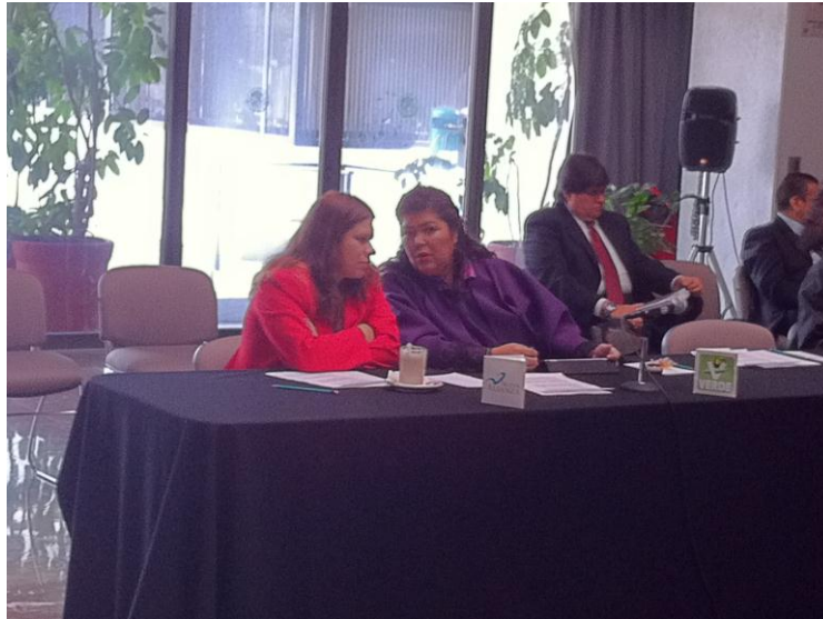
Representación de los partidos políticos en una sesión del OGTAI