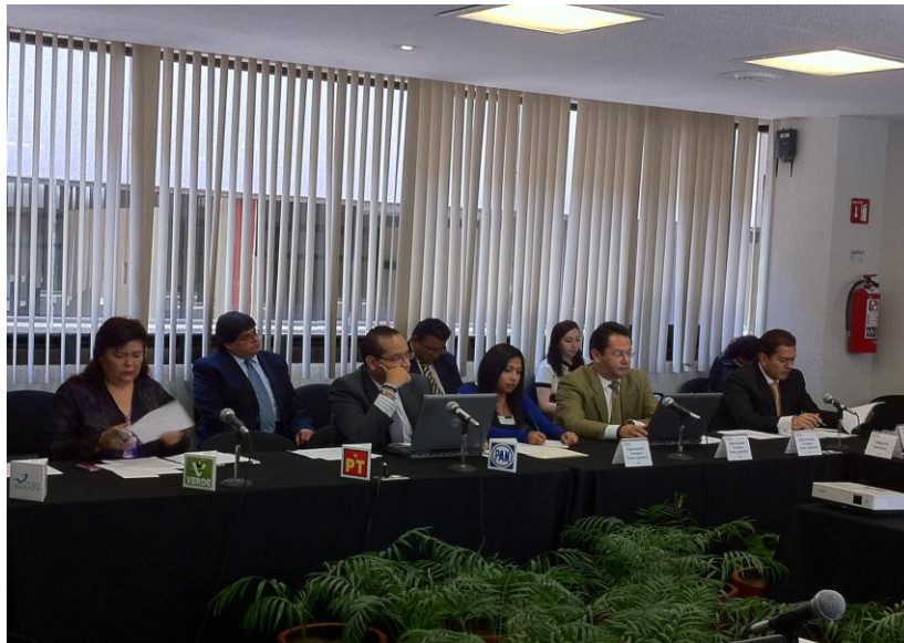
Participación en los grupos de trabajo para las reformas al RIFETAIP

otras atribuciones, proponer modificaciones al marco normativo en la materia; así como dar seguimiento y apoyo a las actividades desarrolladas por los grupos de trabajo que integre el Colegiado de mérito, es por ello que esta Presidencia propuso la creación y conformación de un Grupo de Trabajo, así como su Plan de Trabajo, para llevar a cabo las reformas al RIFETAIP. Para ello siguió un Cronograma a fin de dar celeridad a los trabajos, sin que ello fuera óbice para que se realizara una minuciosa reflexión sobre los aspectos más importantes sobre la reforma al Reglamento en la materia.