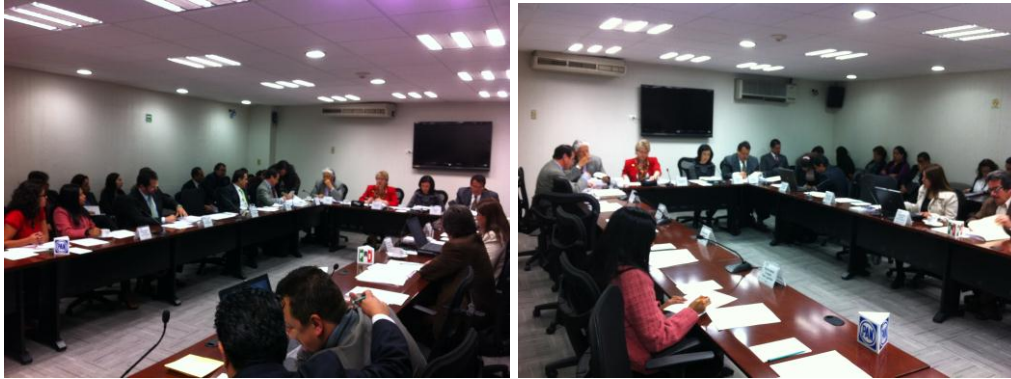
Sesión del Órgano Garante de la Transparencia y el Acceso a la Información Pública de fecha 17 de Noviembre de 2011

En la Cuarta Sesión Ordinaria celebrada el 17 de noviembre en la Sala de Consejeros 1 y 2 del edificio "A", se acordó tener por presentados el Informe del Tercer Trimestre de 2011 de la UTSID y del Comité de Información, respectivamente, aprobándose de igual forma otros asuntos, mismos que se resumen de la siguiente forma: