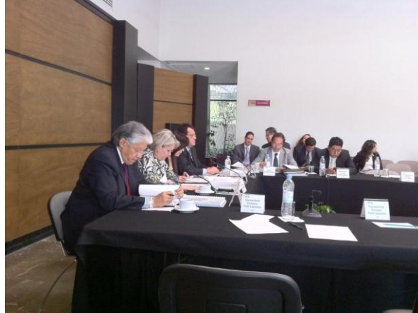
Desahogo del orden del día por los integrantes del OGTAI

que se precisa se interpusieron 117 Recursos de Revisión y 12 Recursos de Reconsideración.