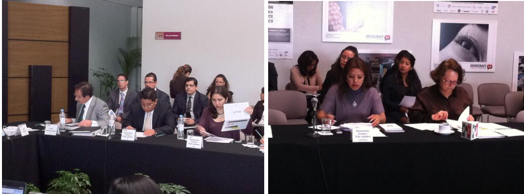
Revisión de puntos de la orden del día por parte de las representaciones del Poder Legislativo