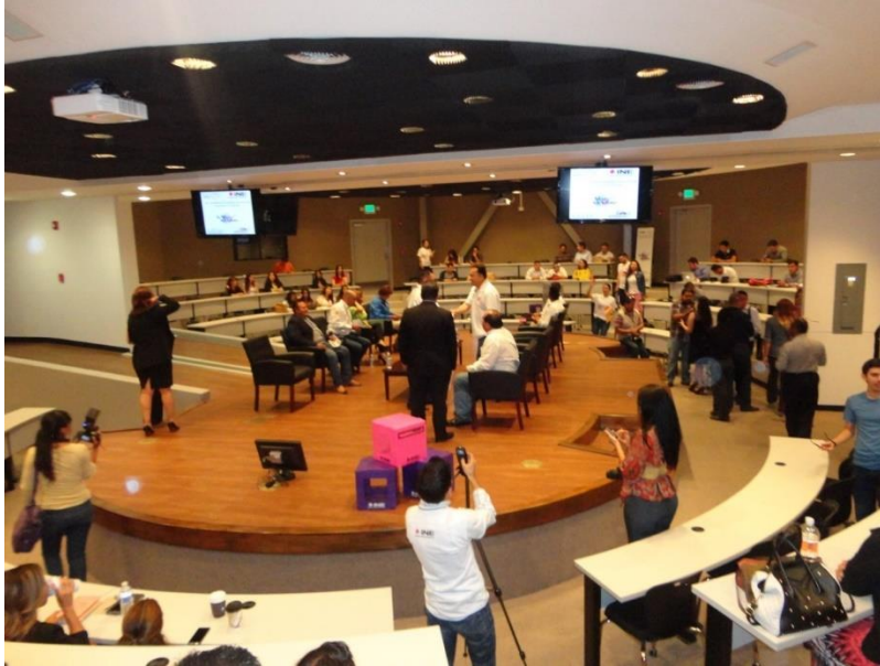
“Foro de Discusión con Partidos Políticos: Tu Voz Mi Voto” Junta Local Ejecutiva de Baja California

Con la finalidad de conocer si las personas que habían participado en las acciones de promoción de la participación realizadas por el Instituto, consideraban útil la información recibida, se realizó el levantamiento de 71,062 encuestas de opinión en las que se observa que el 94% de las y los encuestados opinaron que la pertinencia y claridad de la información o contenidos revisados en la actividad, le son útiles o muy útiles.