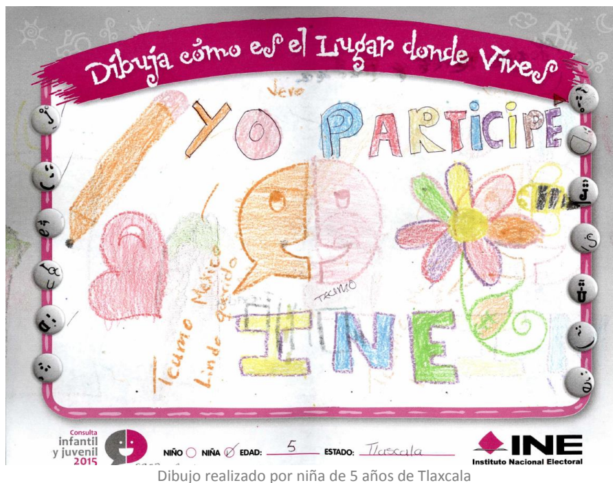
Dibujo realizado por niña de 5 años de Tlaxcala

Una vez concluido en el sistema, el registro de la información de la totalidad de las boletas, para el análisis de las frases abiertas que se incluyeron al final de las mismas, se determinó de manera aleatoria, una muestra estadística con representatividad estatal, para su captura desde las juntas distritales ejecutivas. Como resultado de esta acción, se recuperaron en el sistema un total de 34,560 frases expresadas por las niñas, niños y adolescentes participantes, que están siendo clasificadas y revisadas en un análisis cualitativo que complementará el Informe de resultados de la Consulta.