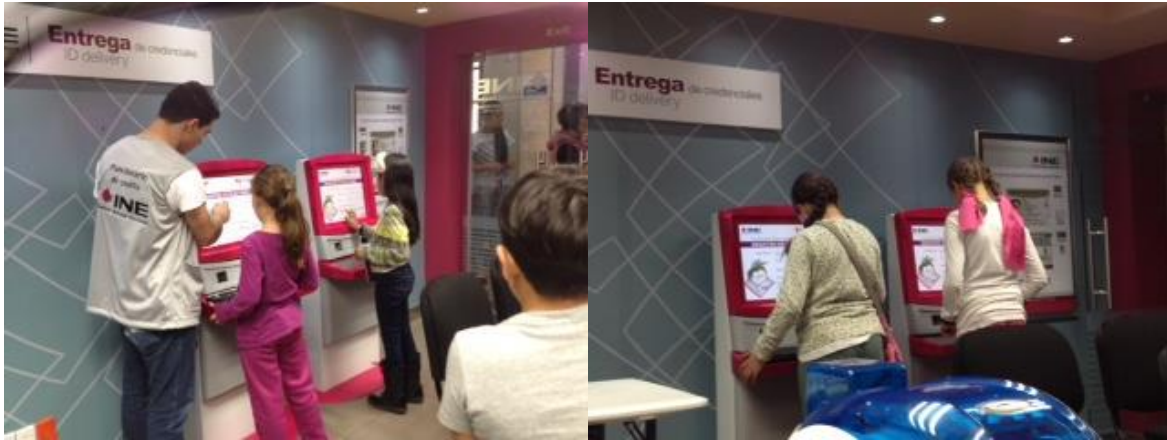
Actividades en el Módulo de Participación Ciudadana en Kidzania, Cuicuilco

Desde su apertura en enero de 2015, niñas, niños y adolescentes han tenido la oportunidad de involucrarse en una actividad basada en una metodología vivencial y el juego de roles, la cual incluye el proporcionarles una credencial que los identifica como ciudadanas o ciudadanos de Kidzania y les permite participar en un ejercicio de consulta, en el cual algunos de los visitantes tienen la oportunidad de desempeñarse como funcionarios de casilla.