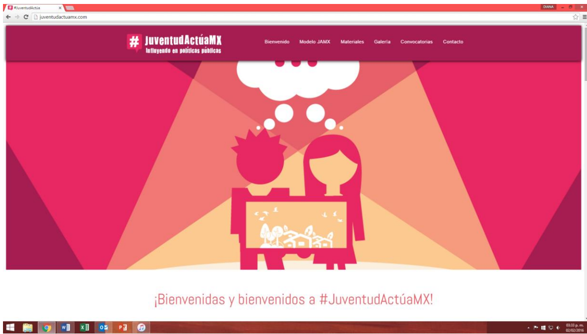
Portal de #JuventudActúaMX