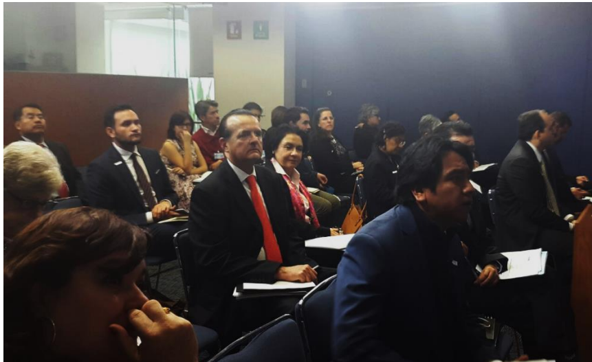
Segundo encuentro de la Comunidad de Práctica INE-PNUD