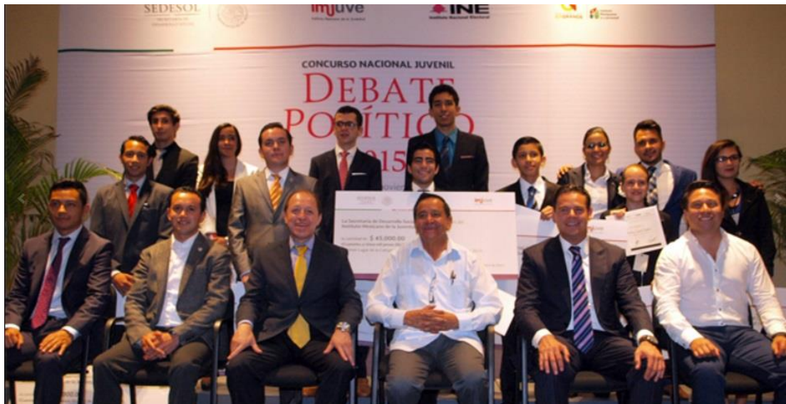
Ganadores del Concurso Juvenil Debate Político 2015 y autoridades

Estos reconocimientos y distinciones se entregaron en la Ceremonia de Premiación y Clausura del Concurso Juvenil Debate Político 2015, evento presidido por autoridades del Instituto Nacional Electoral, el Instituto Mexicano de la Juventud, la Secretaría de Desarrollo Social Estado de México y la Dirección General del Instituto Mexiquense de la Juventud.