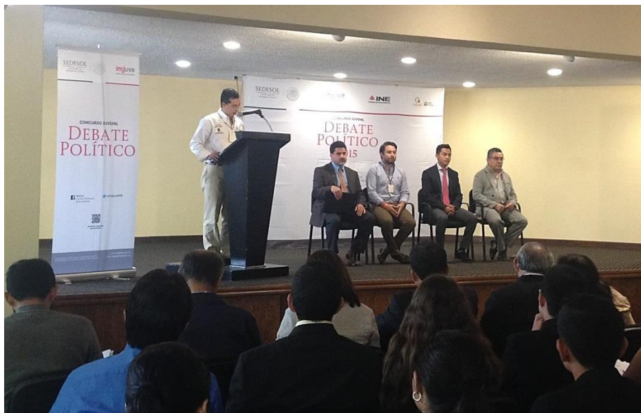
Ceremonia de Inauguración del Concurso Juvenil Debate Político 2015.

La etapa nacional del Concurso Juvenil Debate Político 2015 se llevó a cabo del 9 al 12 de noviembre de 2015, en Ixtapan de la Sal, Estado de México. El presídium de la ceremonia de inauguración estuvo integrado por autoridades de la Junta Local Ejecutiva del Instituto Nacional Electoral en el Estado de México; la Dirección de Enlace con Organizaciones Juveniles del Instituto Mexicano de la Juventud; la Dirección General del Instituto Mexiquense de la Juventud y el Instituto Electoral del Distrito Federal.