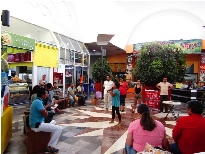
Presentación de la obra de teatro “Democracia, ¿dónde estás?” en Manzanillo, Colima