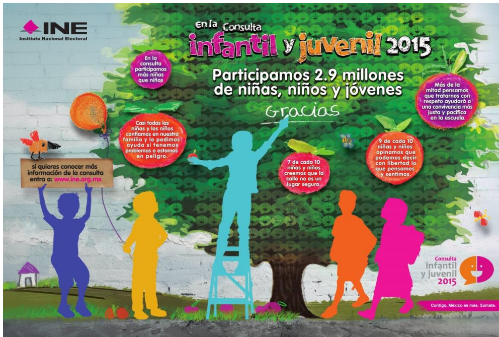
Cartel de resultados versión infantil

Durante este periodo se realizó la impresión total de 175,000 carteles en dos versiones, infantil y juvenil, los que serán distribuidos en las escuelas primarias, secundarias y del nivel medio superior. También, se produjeron y difundieron en radio y televisión dos spots para agradecer la participación de niñas, niños y adolescentes en la Consulta.