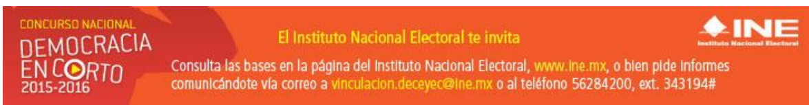
Banner utilizado para la difusión en medio electrónico

En adición a su publicación en el portal del Instituto, esta Dirección Ejecutiva ha llevado a cabo tareas de difusión de esta convocatoria entre estas: la colocación de banners promocionales en los portales de internet Cinepremier y Cuartoscuro los cuales estuvieron habilitados del 21 al 28 de diciembre de 2015.