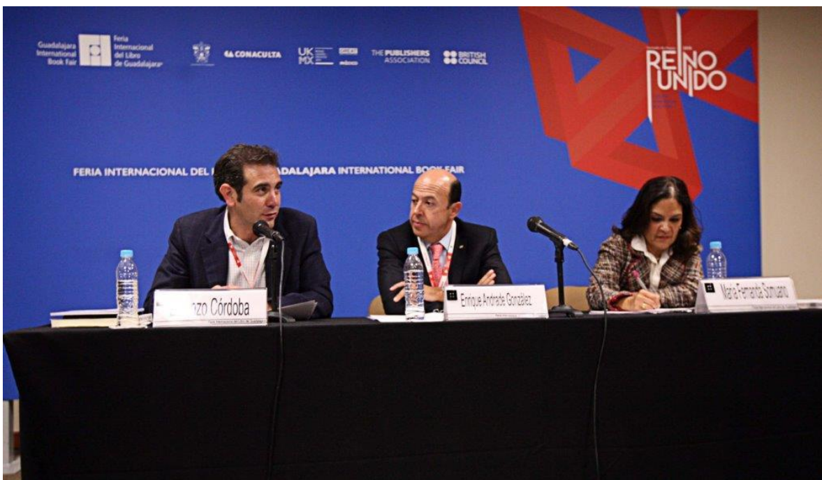
Presentación del Resumen Ejecutivo del Informe país en la Feria Internacional de Libro 2015