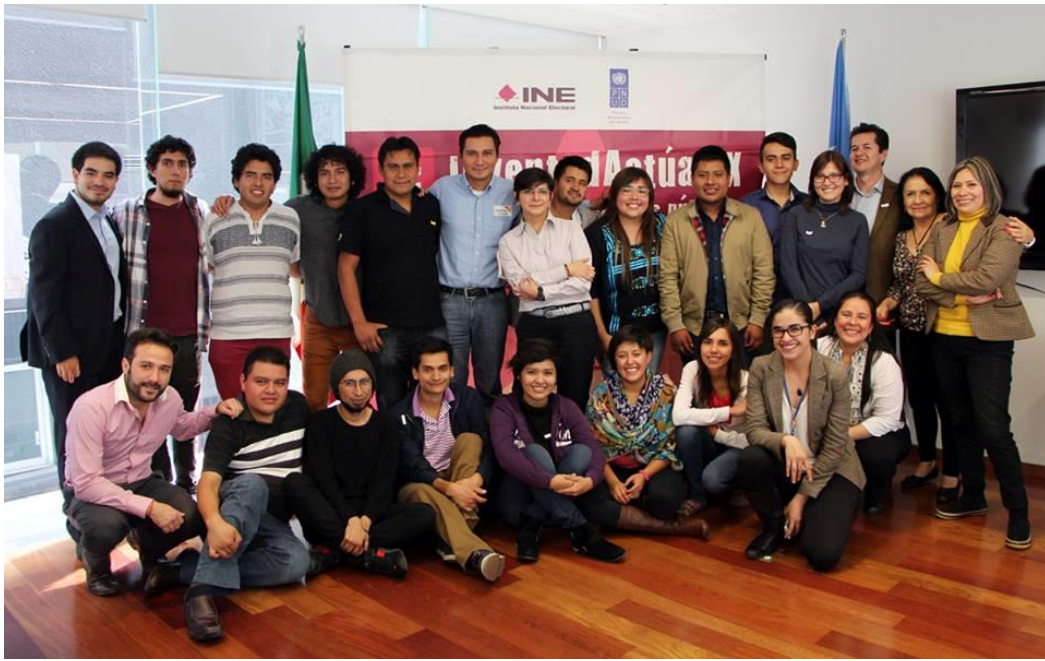
Taller Nacional de Lecciones Aprendidas. Sede de las Naciones Unidas- México

La última actividad en el marco de la evaluación de #JuventudActúaMX fue una reunión con directivos de las OSC participantes celebrada el 23 de octubre de 2015 en la sede de las Naciones Unidas en México. Dicha reunión tuvo el propósito de analizar los resultados obtenidos y definir estrategias de continuidad al trabajo. Se reflexionó también sobre las áreas de oportunidad del proyecto en el contexto de los programas institucionales que realizan tanto el INE como el PNUD en materia de jóvenes.